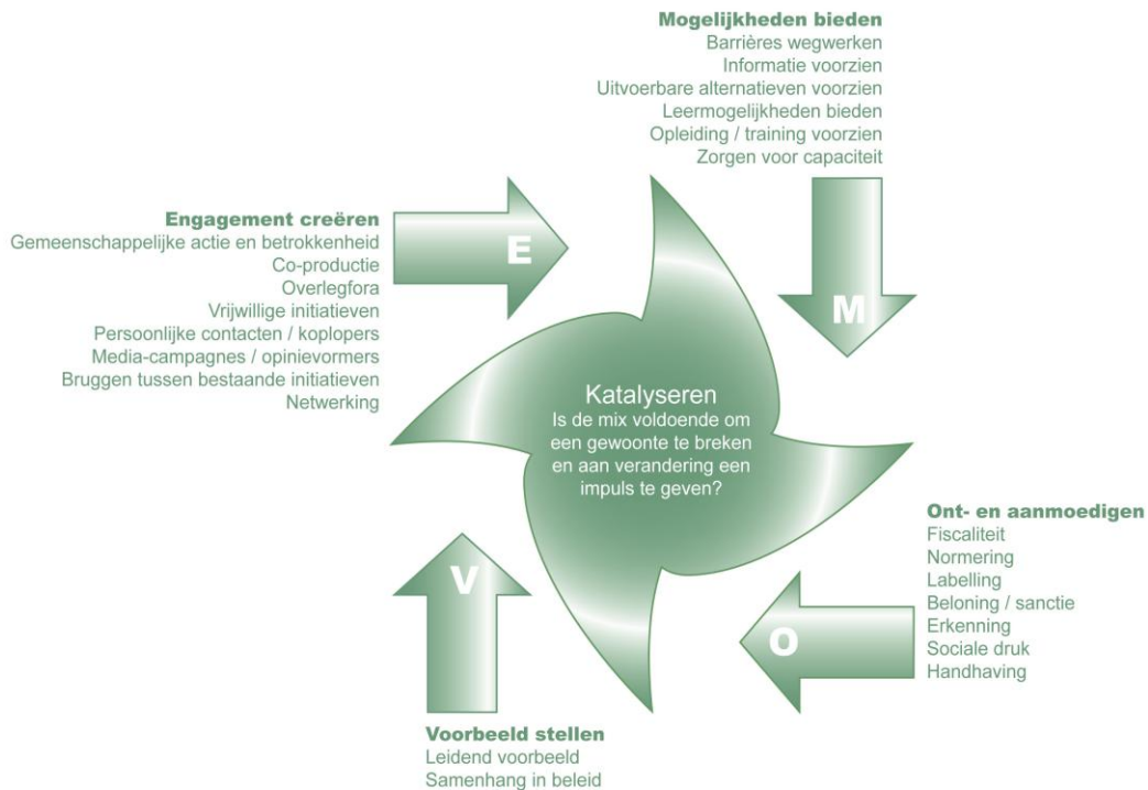
Figuur 2: Engage, enable, exemplify, encourage

Voortbouwend op het AQAL model is een belangrijk principe is dat experimenten de consument of de producent integraal benaderen. Een vergelijkbaar model ontwikkeld door de Britse overheid is het 4E model : engage, enable, exemplify en encourage .